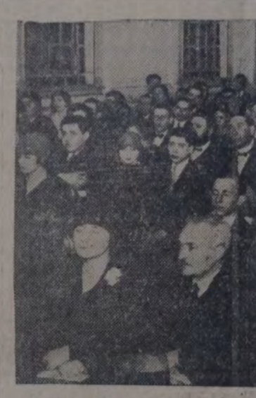
UNA VISTA DEL PÚBLICO ASISTENTE A LA FIESTA ARTISTICA REALIZADA ANTEAÑOCHÉ, CON TODO ÉXITO, EN EL SALÓN DE ACTOS DE LA CASA DEL PUEBLO, POR EL CUADRO ARTISTICO "HEB E", INTEGRADO POR AFILIADOS SOCIALISTAS.