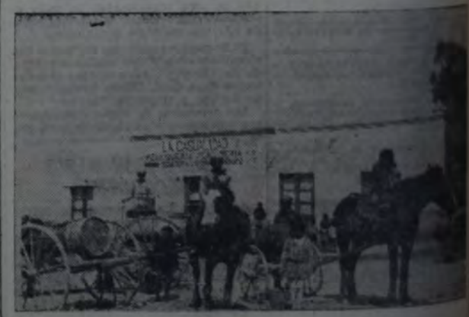
ESPECTACULO DIARIO EN SIERRAS BAYAS

Los gastos que demande el cumplimiento de esta resolución — una vez más — se imputarán a la parte de obras públicas del presupuesto municipal.