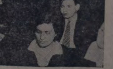
UNA VISTA DEL PÚBLICO ASISTENTE A LA FIESTA ARTISTICA REALIZADA ANTEAÑOCHÉ, CON TODO ÉXITO, EN EL SALÓN DE ACTOS DE LA CASA DEL PUEBLO, POR EL CUADRO ARTISTICO "HEB E", INTEGRADO POR AFILIADOS SOCIALISTAS.