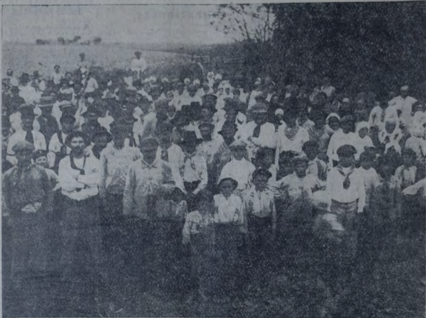
LAS TRAGEDIAS DEL CAMPO ARGENTINO: COLONOS DESALOJADOS DEL LATIFUNDIRIO DE LOS SEÑORES ALVEAR, CERCA DE ROSARIO.

Para refrescar un poco la memoria de ciertos funcionarios que parecen olvidarse hasta de cosas de vital importancia, en la gran asamblea que tendrá lugar el domingo 4 de noviembre en el teatro Español, de Roque Sáenz Peña, se firmará una nota que será enviada a los poderes públicos nacionales pidiendo el cumplimiento de las promesas contenidas en los decretos de los años 1916 y 1917, decretos que establecieron con la máxima claridad, el precio de 10 pesos por hectárea.