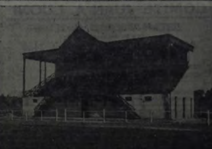
(SANTA FE) HABILITO RECIENTEMENTE SU NUEVA Y ESPACIOSA tribuna, la que dispone de vestuario, baños, etc. El campo de deportes tiene pista para bicicleta, cancha de tenis y se proyecta la construcción de una pista de natación y de un campo especial para niños.